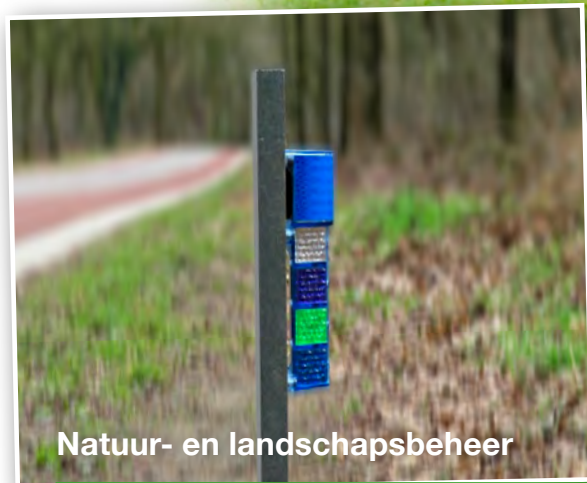
Natuur- en landschapsbeheer