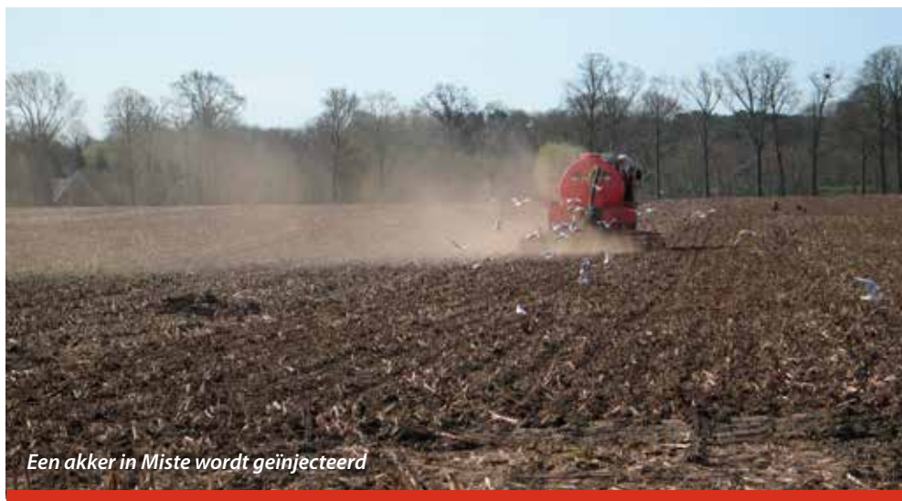
Een akker in Miste wordt geïnjecteerd