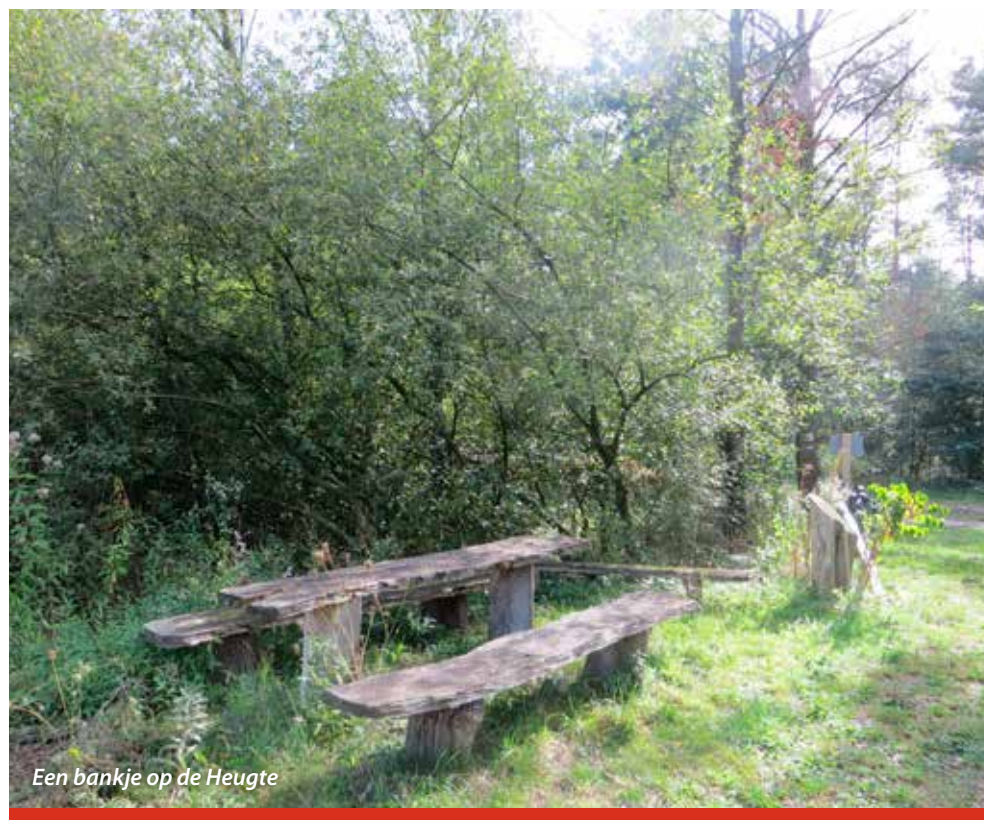
Een bankje op de Heugte