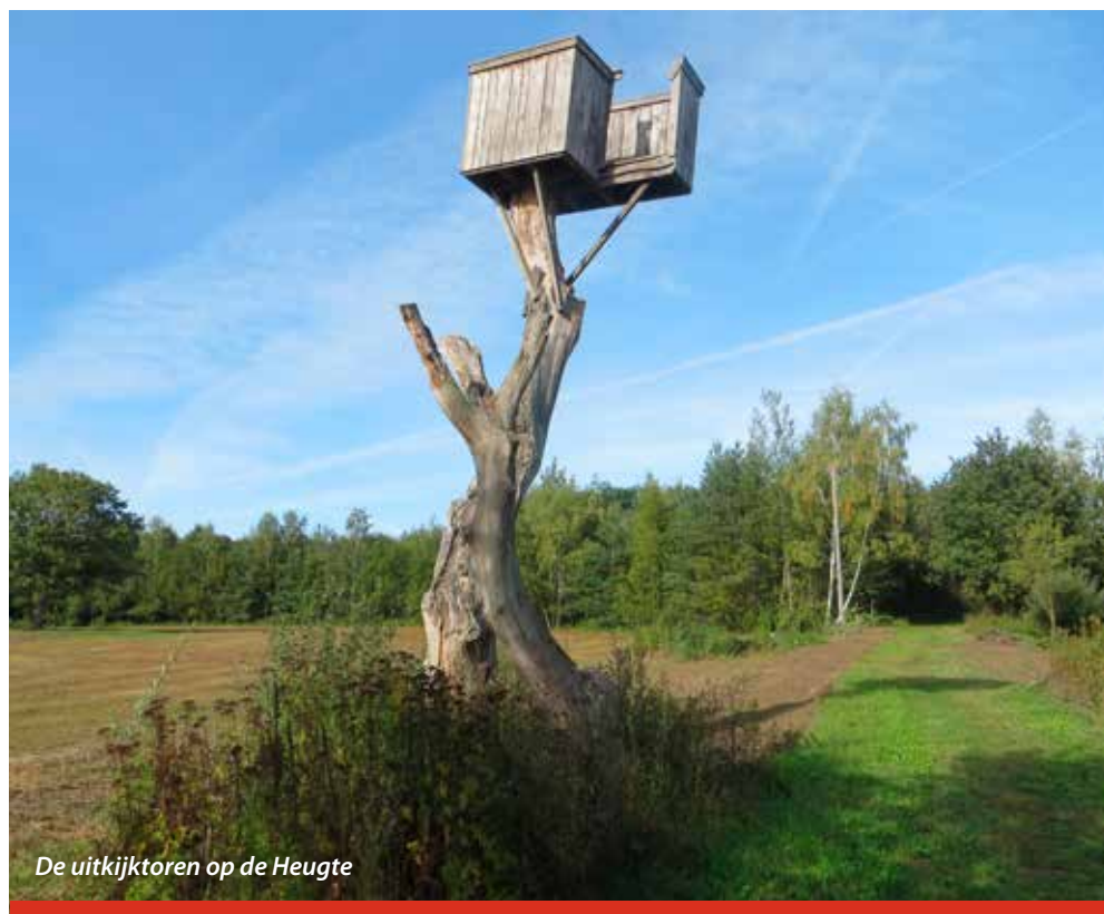
De uitkijktoren op de Heugte